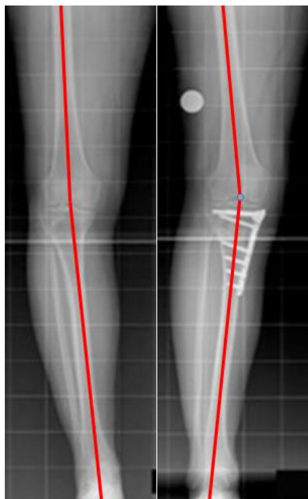
Fig.2: röntgenfotos voor en na correctie van een O-been

Het doel van de operatie is om de pijn te verminderen/weg te nemen en een eventuele toekomstige knieprothese uit te stellen (84% van de patiënten heeft na 9-12 jaar nog geen totale knieprothese nodig). Dit wordt bereikt door de belasting van de versleten zijde van de knie te verminderen. Na de operatie wordt de goede zijde van het gewricht meer belast. Het kan wel een jaar duren voordat het eindresultaat bereikt is. Ongeveer 80% van de patiënten bereikt, ten opzichte van voor de operatie, een vergelijkbaar sportniveau.